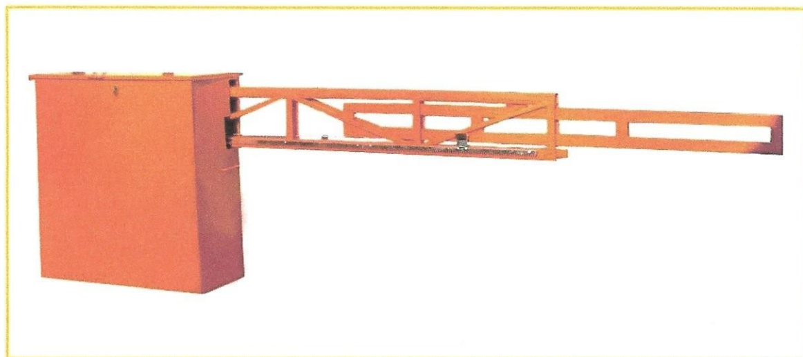
Схема расположения шлагбаумов и КПП на придомовой территории